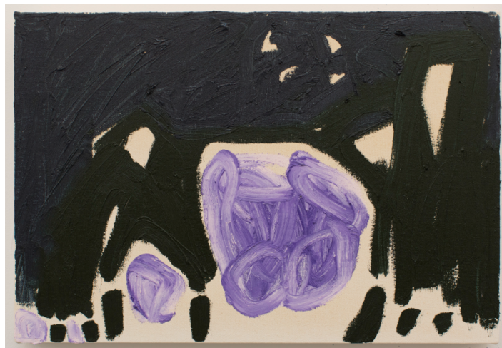
[nca] ジャナイナ・チェツペ|Janaina Tschäpe Body Island IV Oil and oil stick on canvas 48.26×33 cm 2022